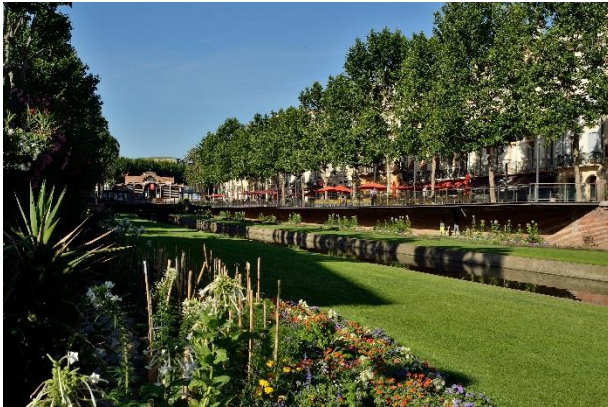
Quai de la Basse