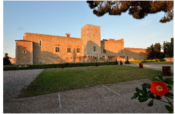
Palais des Rois de Majorque