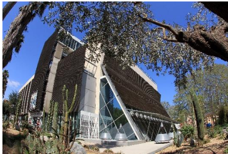
Palais des Congrès